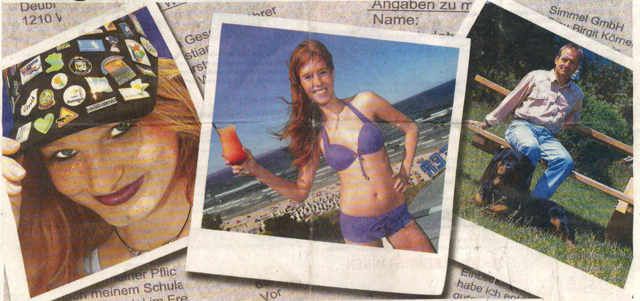
So bitte nicht: Kappe, Bikini und Hund – solche Privatfotos gehören jedenfalls nicht in die Bewerbungsmappe. Man sollte sich seriös und angemessen präsentieren

Den ersten Eindruck über einen Job-Kandidaten liefert das Bewerbungsfoto: Oft ist man darauf nicht im besten Licht.